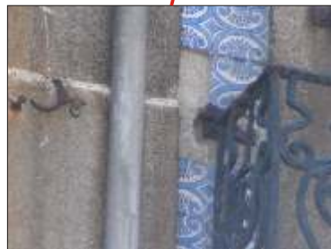
Destacamento de azulejos por oxidação das ancoragens das guardas de protecção.