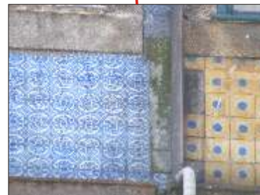
Destacamento de azulejos por humedificação do suporte.