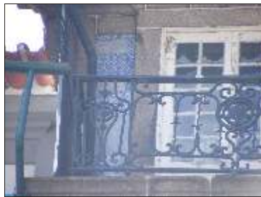
Colmatação de lacunas no revestimento com recurso a argamassa pintada.