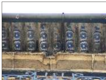
Telhas de remate (telhões vidrados) e caleira em PVC.