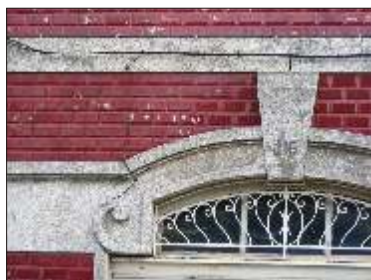
Acção de sais solúveis no interior do azulejo, principalmente concentrada entre o r/c e o 1º andar.