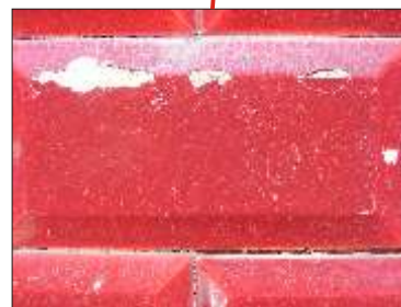
Evolução da acção de cristalização no interior do azulejo: fissuração, desprendimento e destacamento do vidro.