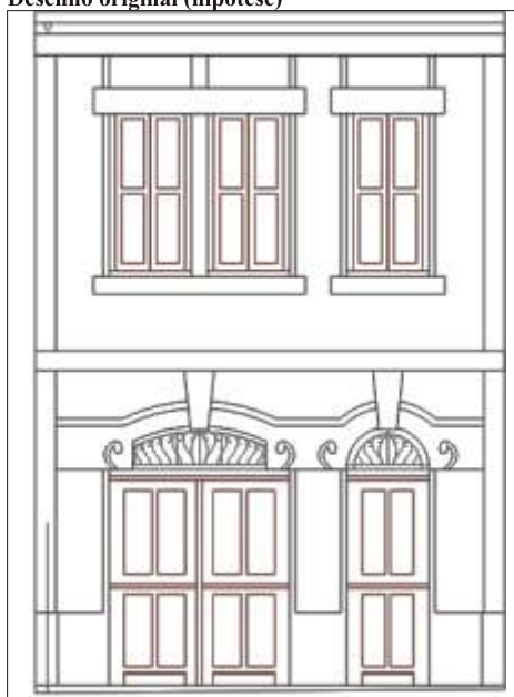
Desenho original (hipótese)

Na intervenção efectuada no revestimento azulejar foi usada, para preenchimento das lacunas, uma argamassa pigmentada.