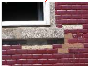
Uso de argamassa de cimento pigmentada a colmatar lacunas antigas. Continuação da queda de azulejos.