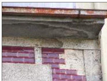
Aplicação de platibanda em betão e queda parcial do revestimento.